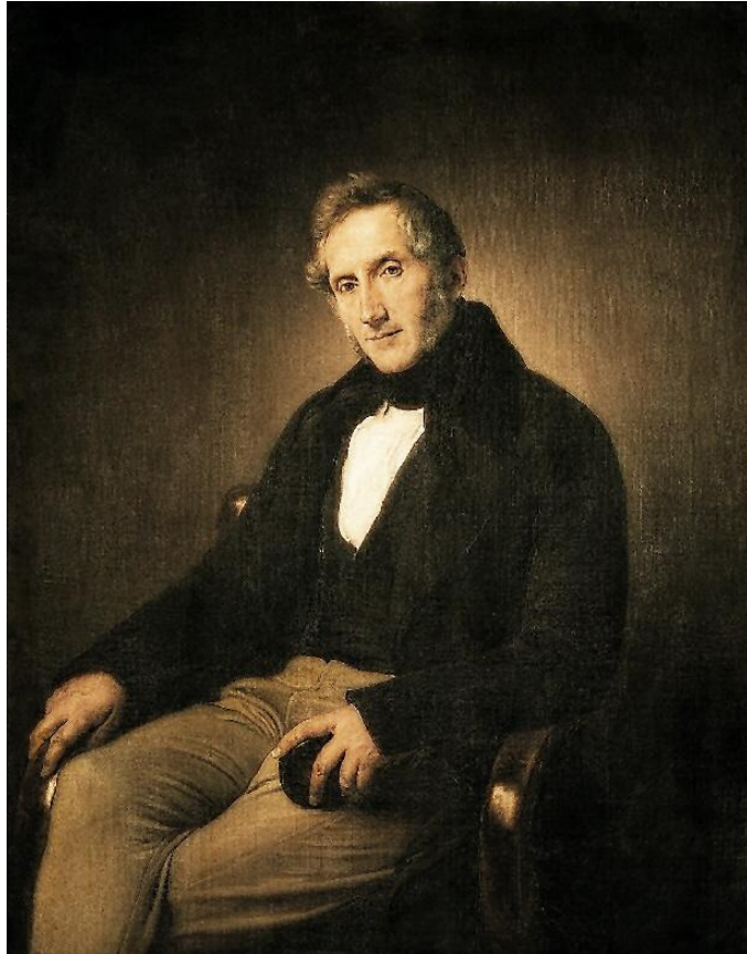
Ritratto di Alessandro Manzoni eseguito dall'Hayez, analogo a quello di Rosmini. Il poeta milanese fu iscritto all'Istituto dal Rosmini stesso con "patente" del 1° marzo 1850

ci ha chiamati con una vocazione santa, non già in base alle nostre opere, ma secondo il suo proposito e la sua grazia» 14 .