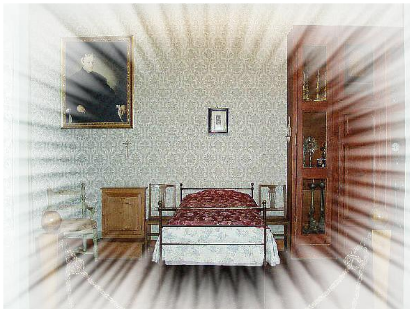
Stresa, Centro Internazionale di Studi Rosminiani: la camera in cui il Beato Antonio Rosmini concluse la sua vita terrena

87. Il tutto, infine, avvenga nella gioia, con libertà di cuore e di volontà, lasciando che ognuno operi secondo il proprio spirito, affinché «ogni vivente dia lode al Signore» (Sal 150).