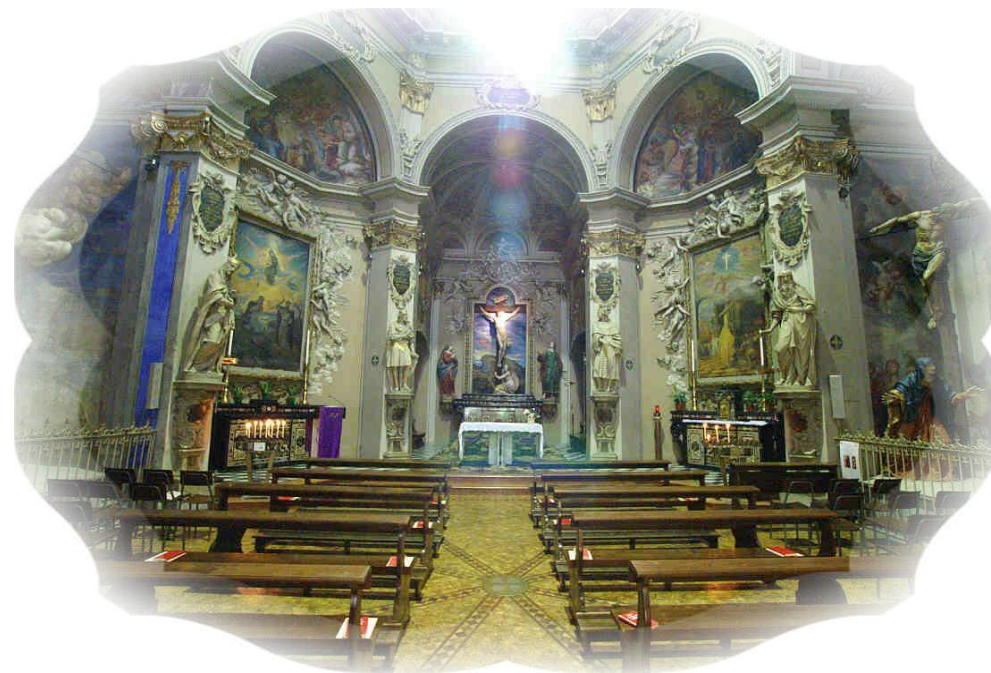
Domodossola, Sacro Monte Calvario: Santuario del SS. Crocifisso