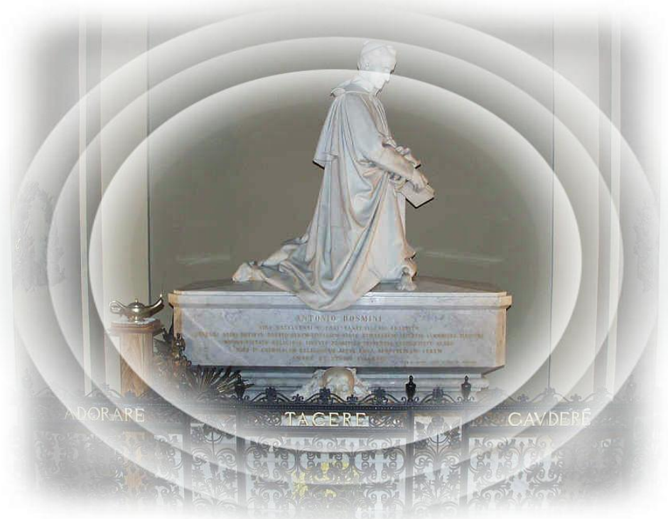
Stresa, il monumento del Vela sopra la tomba del Beato Rosmini nel Santuario del SS. Crocifisso presso il Collegio Rosmini