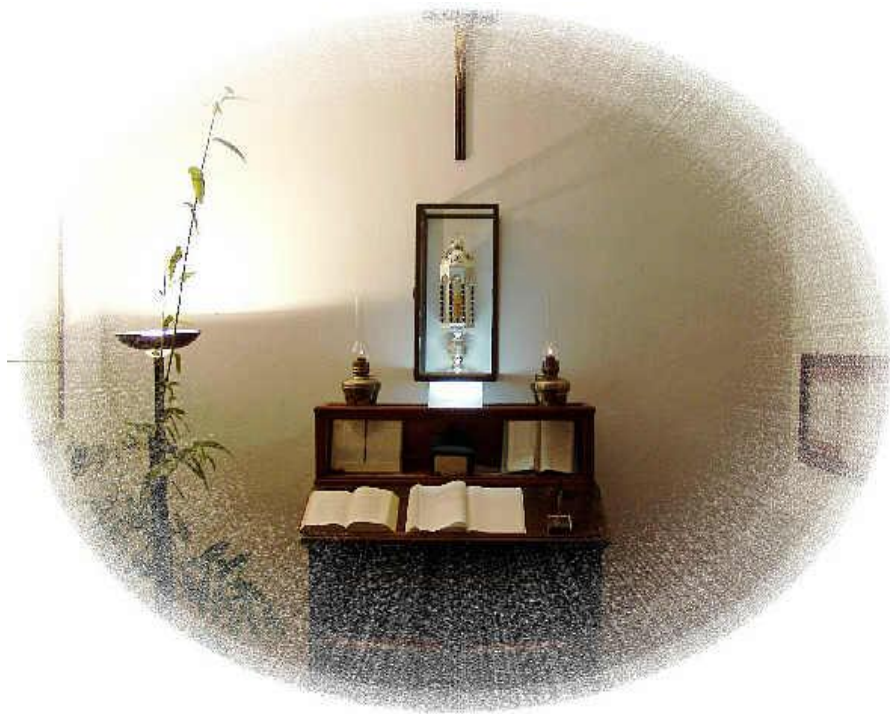
Domodossola, Sacro Monte Calvario Cella del Beato A. Rosmini con la sua reliquia