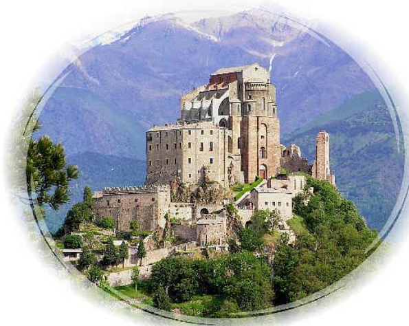
La Sacra di San Michele in Val di Susa

modo di coinvolgere gli Ascritti nelle varie sue opere. È possibile affidare ad un Ascritto, o ad un gruppo di Ascritti, una specifica opera di carità.