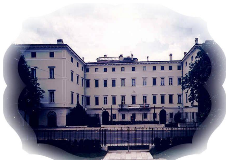
Rovereto Casa Natale del Beato A. Rosmini

La stessa esperienza spirituale è partecipata dalle Suore della Provvidenza Rosminiane, che, sebbene congregazione di diritto pontificio pienamente autonoma, hanno in comune con noi lo stesso Padre e Fondatore.