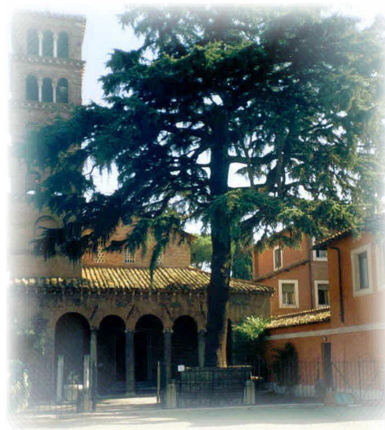
Roma, San Giovanni a Porta Latina, sede di una delle due Case Internazionali di Formazione e della Curia Generalizia dell'Istituto della Carità

In questa linea è stato costituito il "Sodalizio degli ascritti consacrati dell'Istituto della Carità" .