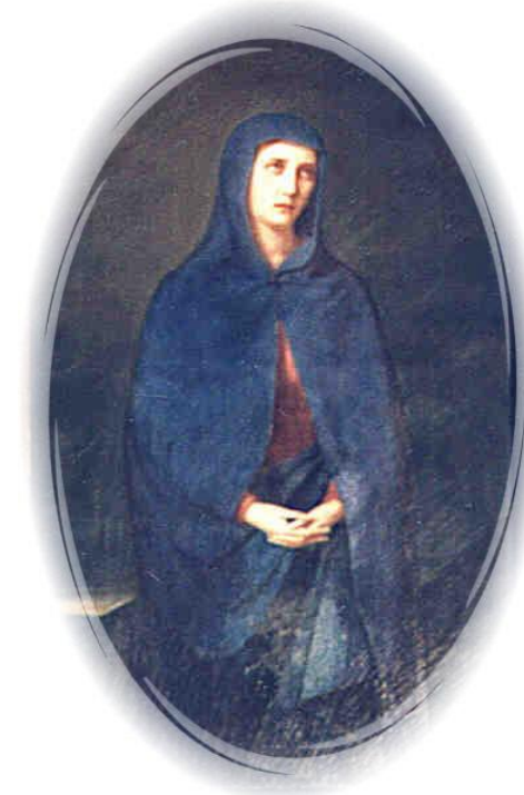
Sacro Monte Calvario, Cappella dei Religiosi quadro dell'Addolorata