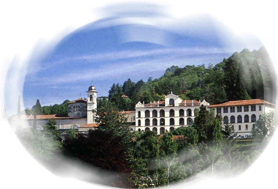
Stresa (VB) – Collegio Rosmini e Santuario del SS. Crocifisso con la Tomba del Beato