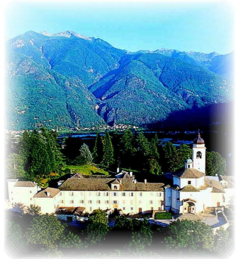
Il Sacro Monte Calvario di Domodossola sede del Noviziato e del Centro di Spiritualità

aprire la Chiesa al mondo e il mondo alla Chiesa, gli Ascritti condividano in modo speciale la sua sollecitudine pastorale e partecipano alla sua missione nel mondo, secondo lo spirito rosminiano.